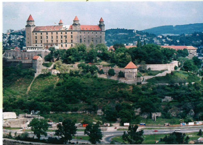
Het Kasteel van Bratislava stond van de 1e tot de 5e eeuw op de grens van het Romeinse Rijk. Tegenwoordig vind je een historisch museum en een muziekmuseum in het gebouw.

Schilderen op glas is een oude Slowaakse traditie. Vooral in de 17e eeuw was deze kunst heel geliefd bij de mensen van adel, de kerk en de rijke handelaren. In de 19e eeuw hadden veel gelovige mensen een glasschilderij met daarop een religieuze afbeelding.