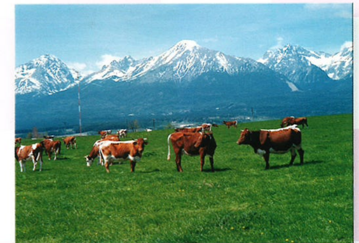
Het Tatra-gebergte ligt op de grens tussen Slowakije en Polen en bestaat uit een aantal hoge bergen.