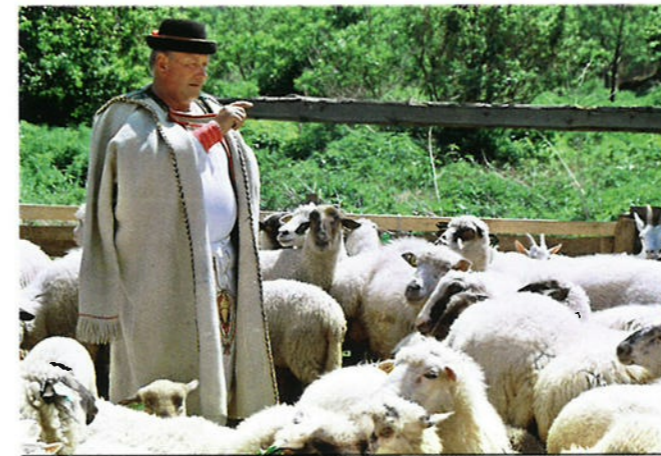
De landbouw en de veeteelt, zoals het houden van schapen, is belangrijk voor het land.

De Slowaken zijn dol op ijshockey en werden in 2002 wereldkampioen. Bij ijshockey strijden twee teams tegen elkaar. Beide teams proberen met een stick een kleine schijf, de puck, in het doel van de tegenstanders te schieten.