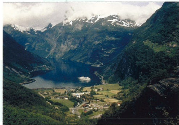
De Geirangerfjord is het mooiste fjord van Noorwegen. Het is een populaire plek voor toeristen.

Er zijn weinig landen waar meer vissen in het water rondzwemmen dan in Noorwegen. Maar Noorwegen biedt meer dan vis: in de grond kun je aardolie en aardgas vinden. Bovendien zijn de havens van het land nooit bevroren. Dit is erg bijzonder voor een land dat zo noordelijk ligt als Noorwegen.