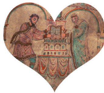
Manuscripten konden erg kostbaar zijn. Hier zie je Dirk II, graaf van Holland en Zeeland. Dirk en zijn vrouw Hildegard schenken een evangelieboek aan de abdij van Egmond (± 975).

In die tijd waren de Goten al tot het christendom bekeerd. Hun bisschop Wulfila had de Bijbel in het Gotisch vertaald. Bijzonder is dat die vertaling gedeeltelijk bewaard is gebleven, in een manuscript uit de 6e eeuw. Het is geschreven met zilveren letters. Daarom heet het de CODEX ARGENTEUS , de 'zilveren codex'.