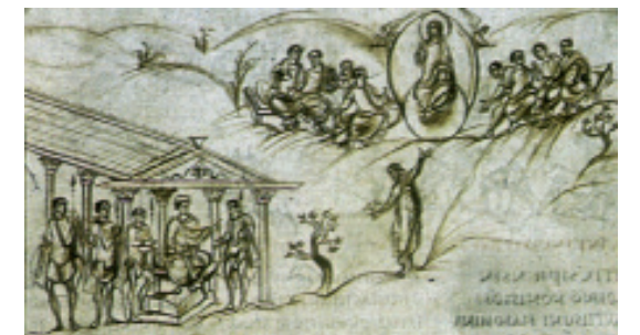
Pentekening uit het Utrechts Psalter , een beroemd psalmboek uit de 9e eeuw. Het wordt bewaard in Utrecht.

In het noordwesten van Frankrijk is eeuwenlang Nederlands gesproken. Maar het Nederlands is er verdrongen door het Frans. In Noord-Frankrijk heb je nog wel veel Nederlandstalige plaatsnamen. Noem een Franse plaats met een Nederlandse naam. (Gebruik zo nodig een atlas.)