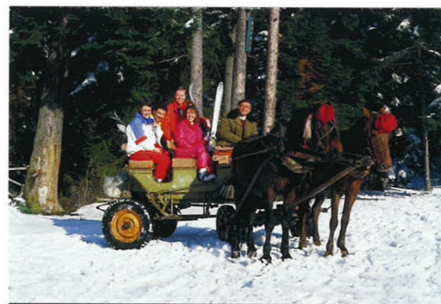
Het skioord Borovets trekt veel toeristen uit Bulgarije en uit het buitenland.

Spartacus was een Romeinse slaaf. In de 1e eeuw voor Chr. werd hij de leider van de beroemdste slavenopstand in de geschiedenis van het Romeinse Rijk. Hij kwam uit het gebied dat nu Bulgarije genoemd wordt.