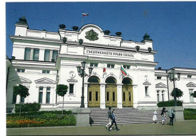
Bulgarije is sinds 1991 een democratisch land. Dat wil zeggen dat het volk mensen kiest die het land mogen leiden. De foto laat het regeringsgebouw zien.