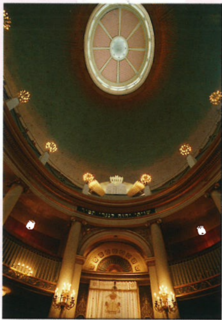
Omdat in Bulgarije alle godsdiensten zijn toegestaan, vind je er verschillende soorten 'godshuizen', zoals kathedralen.