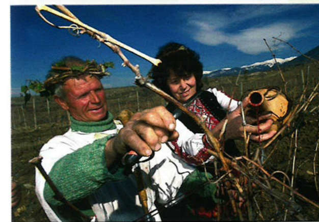
Deze boeren dragen traditionele kleding. Ze vieren een wijnfeest. In Bulgarije wordt al 2.500 jaar wijn gemaakt en gedronken.