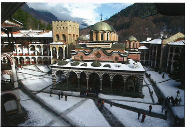
Het Rila Klooster uit de 10e eeuw is het grootste klooster van Bulgarije en ook de meest heilige plek van het land.

Spartacus was een Romeinse slaaf. In de 1e eeuw voor Chr. werd hij de leider van de beroemdste slavenopstand in de geschiedenis van het Romeinse Rijk. Hij kwam uit het gebied dat nu Bulgarije genoemd wordt.