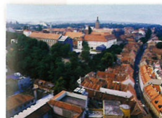
Zagreb is de grootste stad van Kroatië. Aan de ene kant de stad ligt de berg Medvenica en aan de andere kant vind je de rivier de Sava.

Kroatië is een van de landen die vroeger het land Joegoslavië vormden. Het wordt omringd door Slovenië, Hongarije, Servië, Bosnië en Herzegovina, en Montenegro. Toen Kroatië in 1991 een eigen land wilde vormen, brak er een oorlog uit, die tot 1992 duurde. Kroatië is een mooi land, dat veel toeristen trekt. Het land heeft een prachtige kust en telt heel veel kleine eilandjes in de Adriatische Zee. De stad Dubrovnik stamt uit de middeleeuwen. Van alle mensen die in Kroatië wonen, bestaat het grootste deel uit Kroaten. Een op de tien inwoners is Serviër en een klein deel van de bevolking komt uit de buurlanden.