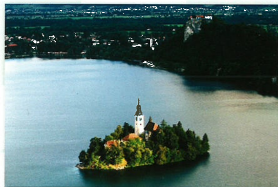
Het Meer van Bled ligt in het noordwesten van Slovenië. Het is een van de mooiste meren van de Alpen en een populaire plek voor toeristen.

Van alle landen die vroeger bij Joegoslavië hoorden, is Slovenië het enige land waar bij.