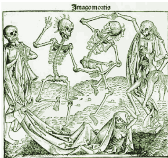
De pest of de Zwarte Dood wordt in de Middeleeuwen uitgebeeld als geraamtes.

In de Middeleeuwen (rond 1350) doodt de pest (ook wel de Zwarte Dood genoemd) één derde van alle mensen. Ze weten niet hoe de ziekte ontstaat. Ze geven de schuld aan buitenlanders, aan mensen die een zonde begaan (zoals stelen), aan de stand van de planeten, aan vervuild water of aan slechte lucht.