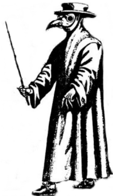
De doktoren in de Middeleeuwen proberen zich in deze kleding tegen de pest te beschermen

Kappers zijn tegelijkertijd doktoren. Zij combineren het knippen van je haren met het verrichten van kleine operaties. Je kunt ook beter worden door een pelgrimstocht te maken, door een koning of koningin aan te raken, door planetenkaarten te raadplegen of door bloedzuigers op je lichaam te zetten.