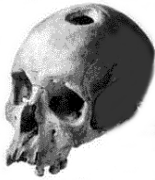
Schedel met gat

Mensen beter maken is een van de oudste beroepen van de wereld. Maar veel kunnen de genezers nog niet doen.