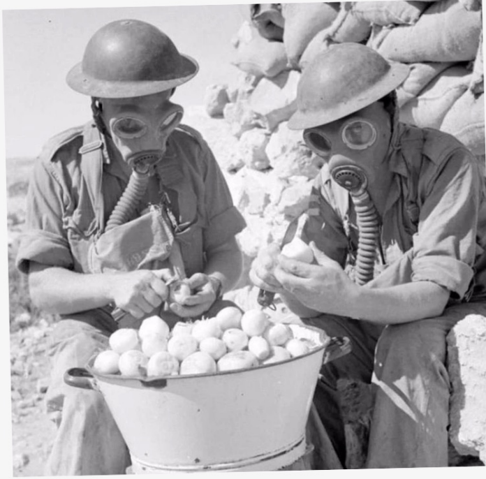
het gifgas en het gasmasker