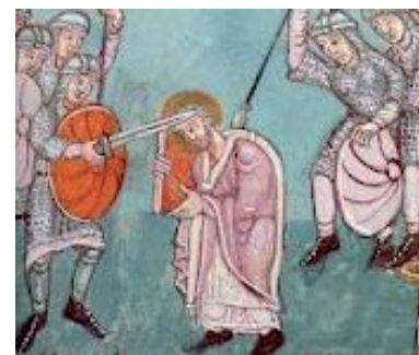
De moord op Bonifatius. (afbeelding uit de 10e eeuw)

Eerst probeerde Willibrord om koning Radboud te bekeren. Maar dat lukte niet. Meer succes had hij bij de Friezen die woonden in het Hollands-Zeeuwse kustgebied. Hij stichtte er kerkjes. Er wordt gezegd dat Willibrord op Walcheren een heidens heiligdom vernielde. Dat klinkt nogal gevaarlijk, maar je moet weten dat hij Frankische soldaten bij zich had.