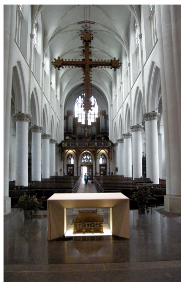
Sint-Catharinakathedraal In deze Utrechtse kerk staat de reliekschrijn van Willibrord. Daarin zitten botjes van zijn skelet.

Trefwoorden: christendom, Franken, Friezen, Germanen, Utrecht.