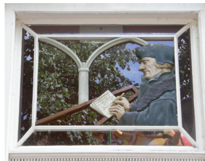
Erasmus ging naar de Latijnse school in Deventer. Hij is afgebeeld in een raam van het schoolgebouw.

Erasmus werd geboren in Rotterdam, maar groeide op in Gouda. Toen hij ongeveer 20 was, werd hij monnik in een klooster. In het klooster stonden boeken uit de KLASSIEKE OUDHEID (dus uit de tijd van de Grieken en Romeinen). Erasmus bestudeerde die boeken en werd heel goed in Latijn . Later leerde hij ook Grieks .