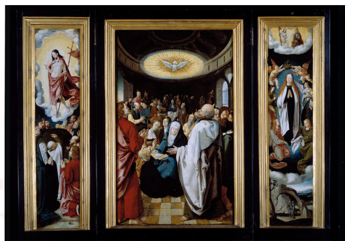
Drieluik met Nederdaling van de Heilige Geest, Hemelvaart van Christus en Maria Tenhemelopneming. Omgeving van Lucas van Leyden, tweede kwart 16e eeuw ABM s114

► Dit schilderij gaat over Pinksteren. Zie je de vlammetjes boven de hoofden van de apostelen? Wat kun je nog meer ontdekken op het schilderij?