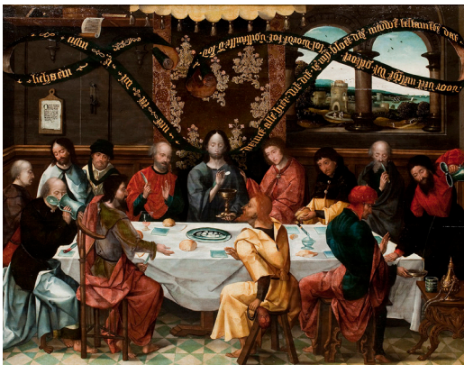
'Laatste Avondmaal', 1515-1524, Meester van 1518

Welke feestdagen zijn er? Kies 1 feestdag uit en leg uit wat er die dag gevierd wordt en hoe die dag er dan uit ziet: wat wordt er gegeten? Horen er speciale gerechten en rituelen bij? Vier je zelf deze feestdag ook? Wat vind je er bijzonder aan? Zoek er een paar mooie foto's en plaatjes bij op internet en sla deze op, zodat je ze later kunt gebruiken.