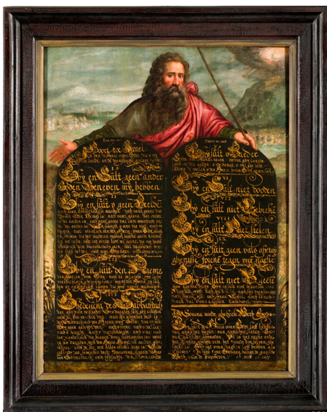
Tiengebodenbord met Mozes Noordelijke Neder- landen, eerste kwart 17e eeuw RMCC s13