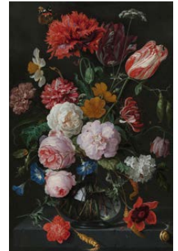
Stilleven met bloemen in een glazen vaas Jan Davidsz. de Heem