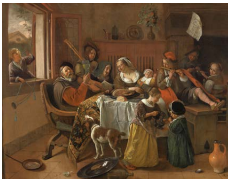
Het vrolijke huisgezin Jan Steen