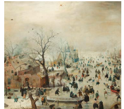
Winterlandschap met schaatsers Hendrick Avercamp