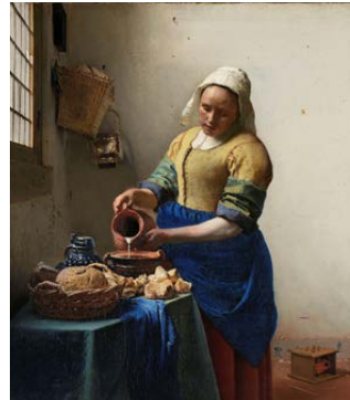
Het melkmeisje Johannes Vermeer