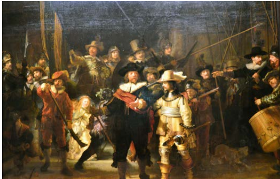
De Nachtwacht Rembrandt van Rijn

Reken het uit en maak er een cirkeldiagram van.