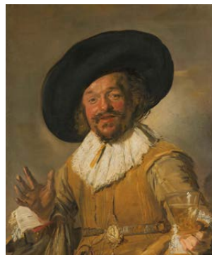
De vrolijke drinker Frans Hals