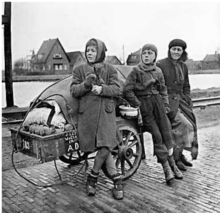
(Mensen met handkar op hongertocht)

Op de volgende bladzijde vind je een kleurplaat over de hongerwinter . Kleur de kleurplaat.