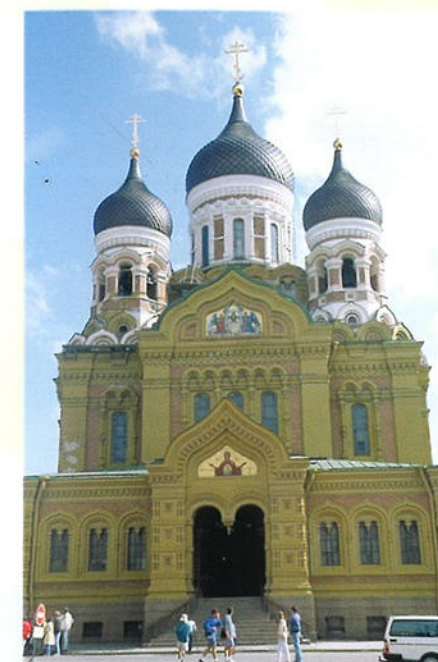
De Russisch-orthodoxe kerk in Tallinn. De Russen en de Esten hebben hun eigen taal, godsdienst en tradities.