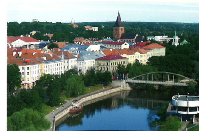
Tartu is na Tallinn de grootste stad van Estland. In de rustige en bosrijke stad vind je een grote universiteit.