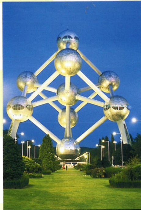
Het Atomium in Brussel werd voor de wereldtentoonstelling in 1958 gebouwd en stelt een ijzerkristal voor.

Aan het eind van de 19e, begin van de 20e eeuw vormde Brussel het centrum van de art nouveau. Dit is een richting binnen de kunst, waarin gewerkt wordt met mooie, sierlijke en ronde vormen.