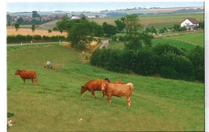
Op deze foto zie je een typisch Belgisch plattelandsschap.