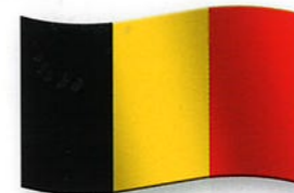
In België wonen veel schrijvers en tekenaars van stripboeken. Sommige zijn wereldberoemd.