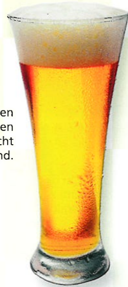
Met honderden verschillende soorten bieren is België een echt bierland.