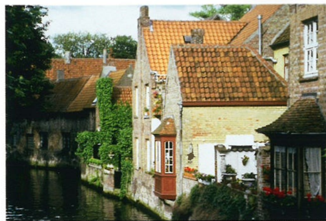
In de Middeleeuwen was het Vlaamse Brugge een van de economische middelpunten van Europa.

Doordat Brussel de hoofdstad is van de Europese Unie, wonen er veel ambtenaren en diplomaten in de stad. De enige stad ter wereld waar meer mensen in hun werk te maken hebben met politiek en bestuur, is Washington, de hoofdstad van de Verenigde Staten.