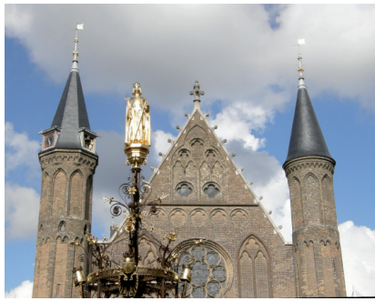
De Ridderzaal met het beeldje van Willem II op het Binnenhof in Den Haag.