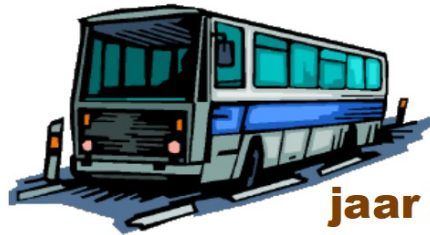
jaar 3 - 21270