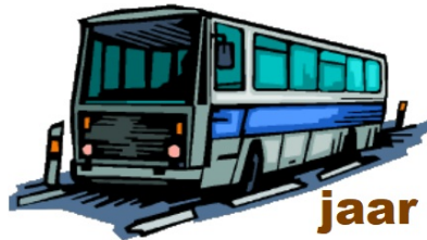
jaar 4 - 20190