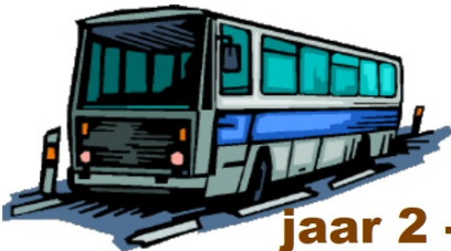
jaar 2 - 25040