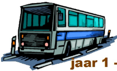
jaar 1 - 23520

Al vier opeenvolgende jaren wordt de bus gebruikt voor vakantie-reizen. Bij elk jaar staat hoeveel kilometer de bus heeft gereden.