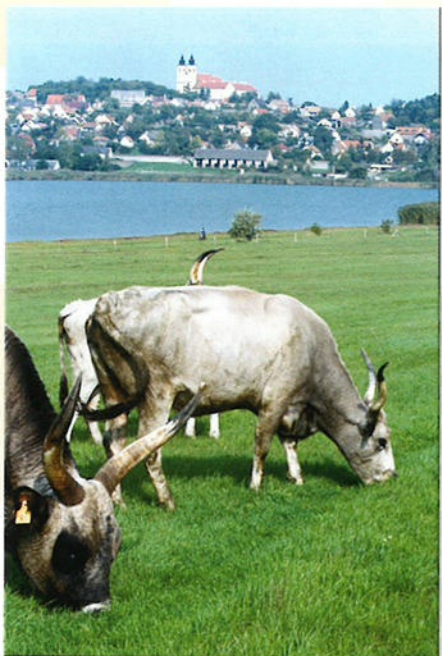
Het Balatonmeer ligt in het westen van het land. Het is een van de meest toeristische plekken van Hongarije.