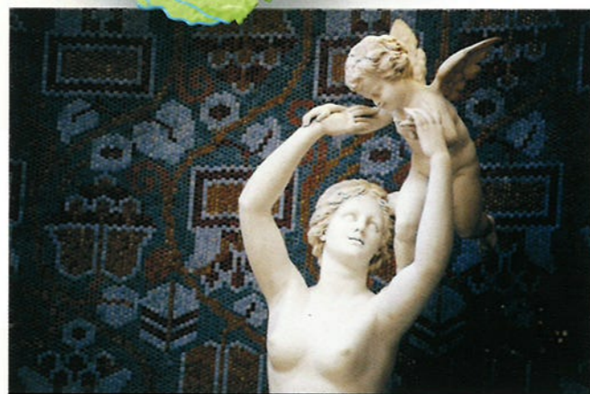
In het badhuis van Gellert vind je dit standbeeld. Het is een van de mooiste badhuizen van Boedapest.