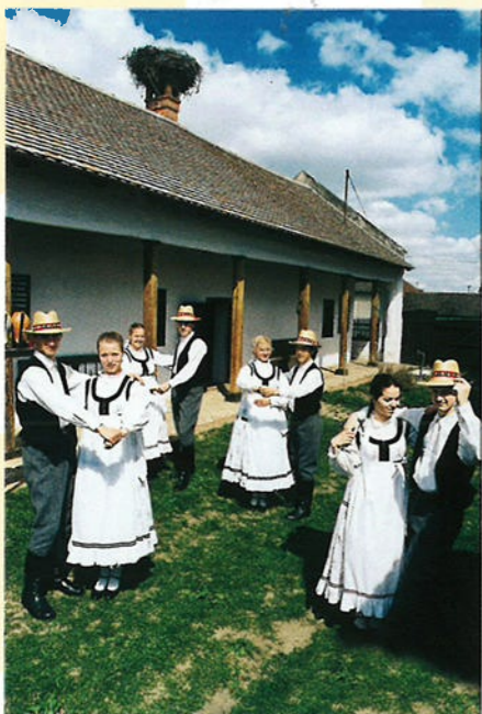
Volksdansen, zoals hier op het platteland, hoort bij de cultuur van het land. In de 19e eeuw was de plattelandscultuur voor grote Hongaarse kunstenaars en wetenschappers een belangrijk onderwerp.

Bijna alle Europese talen horen bij de Indo-Europese talen. Bij deze groep horen de Romaanse talen, zoals het Italiaans en het Frans, de Germaanse talen, zoals het Duits en het Engels, en de Slavische talen, zoals het Russisch en het Pools. Het Hongaars hoort hier niet bij, en is een taal apart. Net zoals het Fins en het Baskisch.