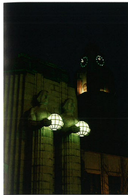
In Helsinki wonen heel veel architecten die wereldwijd bekend zijn. Op de foto zie je het station van Helsinki, gebouwd in 1919.