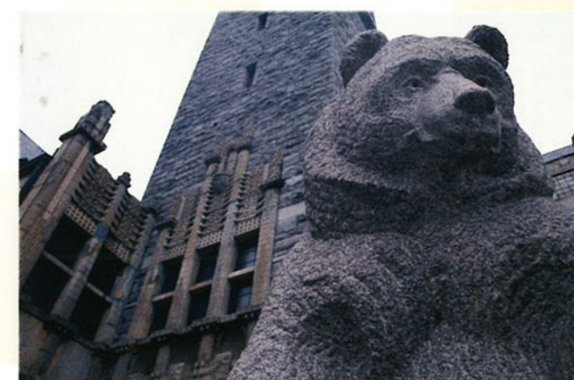
Zo'n 100.000 jaar geleden zouden er voor het eerst mensen in Finland geleefd hebben. In het Nationaal Museum van Finland (foto) vind je alles over de Finse geschiedenis.

In Finland vind je wel 1,7 miljoen sauna's. In de saunaruumtes wordt water op gloeiend hete stenen gegoten. De stoom die ontstaat, laat je lichaam zweten. Zo word je schoon en raak je ontspannen.