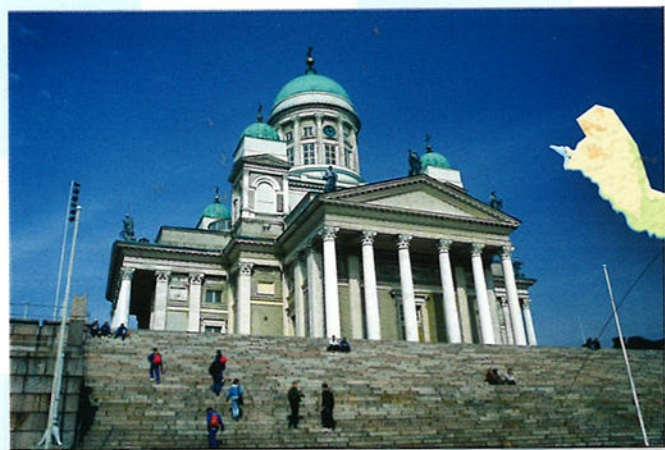
Aan het begin van de 19e eeuw veroverde Rusland Finland en noemde het Grootvorstendom Finland. Helsinki werd de hoofdstad. De stad werd toen opnieuw opgebouwd en kreeg een nieuw centrum: het Senaatsplein.