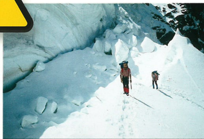
Het hoogste punt van de Oekraïense Karpaten wordt de Hora Hoverla genoemd. Deze top is 2.061 m. hoog.

Een deel van de bevolking van Oekraïne is lid van de Uniate kerk, die in de 16e eeuw werd opgericht. Deze godsdienst lijkt op de katholieke godsdienst.