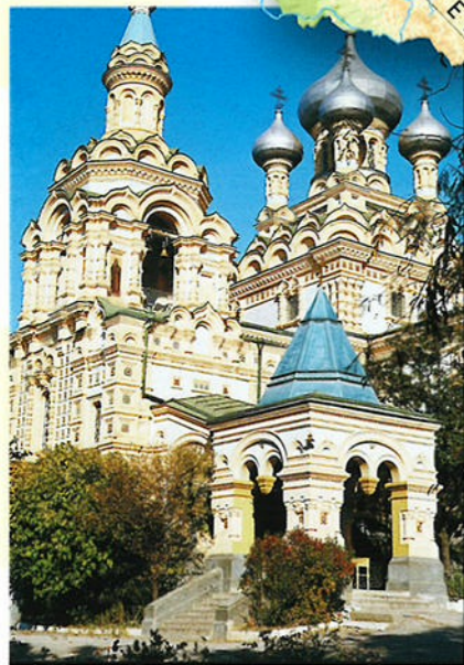
Veel Russen wonen op het schiereiland Krim, bijvoorbeeld in de stad Jalta (foto).