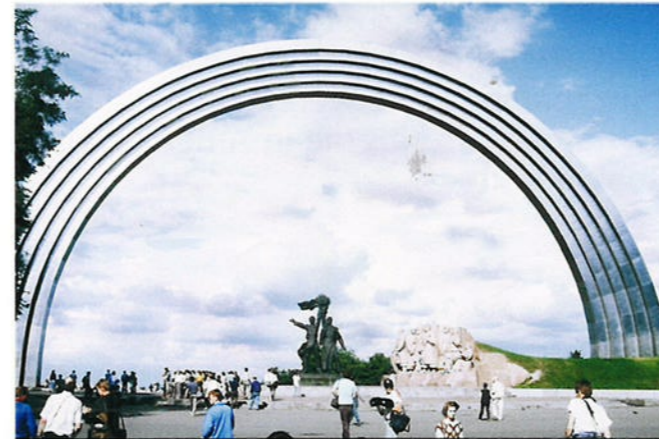
Met dit bouwwerk wordt de (gedwongen) deelname van Oekraïne aan de Sovjet-Unie herdacht.