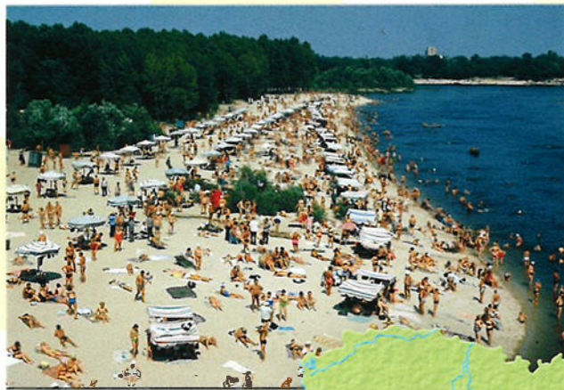
De Dnjepr is de grootste rivier van Oekraïne en stroomt door de stad Kiev.