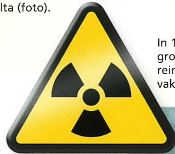
In 1986 ontplofte de kerncentrale Tsjernobyl. Een groot gebied rondom de kerncentrale raakte verontreinigd. Bepaalde vormen van kanker komen daar nu vaker voor dan voor de ontploffing.