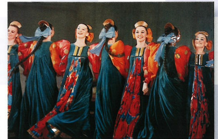
Veel traditionele dansen zijn alleen bedoeld voor vrouwen. Bij andere dansen hebben de mannen juist weer een heel grote taak.

In de 16e eeuw vluchtten veel boeren naar de steppegebieden in het zuiden van Oekraïne. Ze waren op de vlucht om te voorkomen dat ze tot slaven gemaakt zouden worden. Ze slokten zich aan bij een volk dat de Tataren heette, en bij Russen die ook op de vlucht waren. Deze groep mensen werd 'Kozakken' genoemd (oftewel avonturiers). De Kozakken vormen een belangrijke deel van de Oekraïense cultuur.