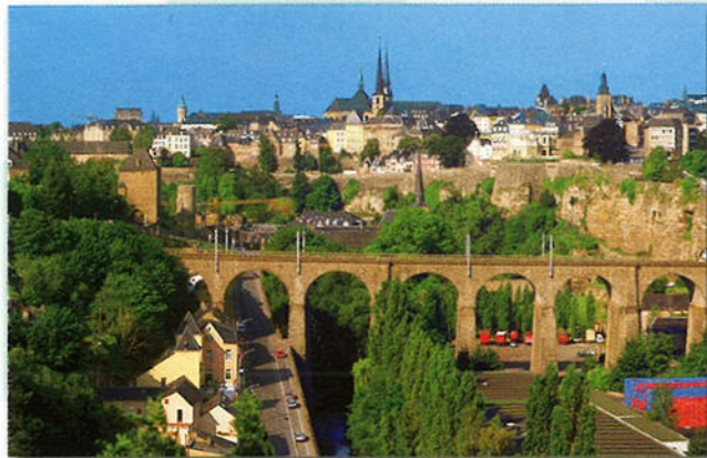
Er wonen bijna 80.000 mensen in de hoofdstad Luxemburg.