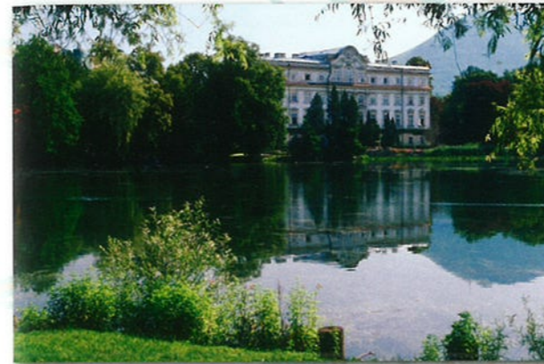
De beroemde componist W.A. Mozart is in Salzburg geboren. In deze stad vind je bovendien prachtige gebouwen. Mozart leefde in de 18e eeuw en was een van de grootste componisten.