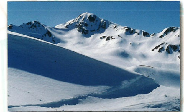
De Alpen zijn verdeeld over zeven landen en vormen samen het hoogste en grootste gebergte van Europa.