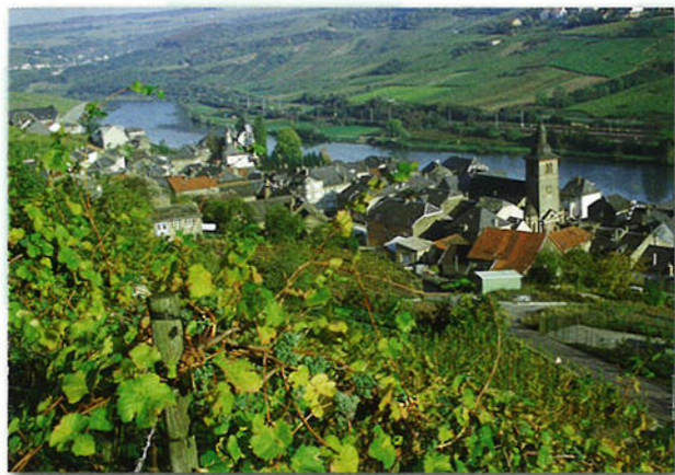
Het Moezeldal is een van de noordelijkste wijnbouwgebieden ter wereld.

Het land dankt zijn naam aan een klein kasteel met de naam Lucilinburhuc. Het werd in het jaar 963 bij de rivier de Alzette gebouwd door graaf Siegfried.